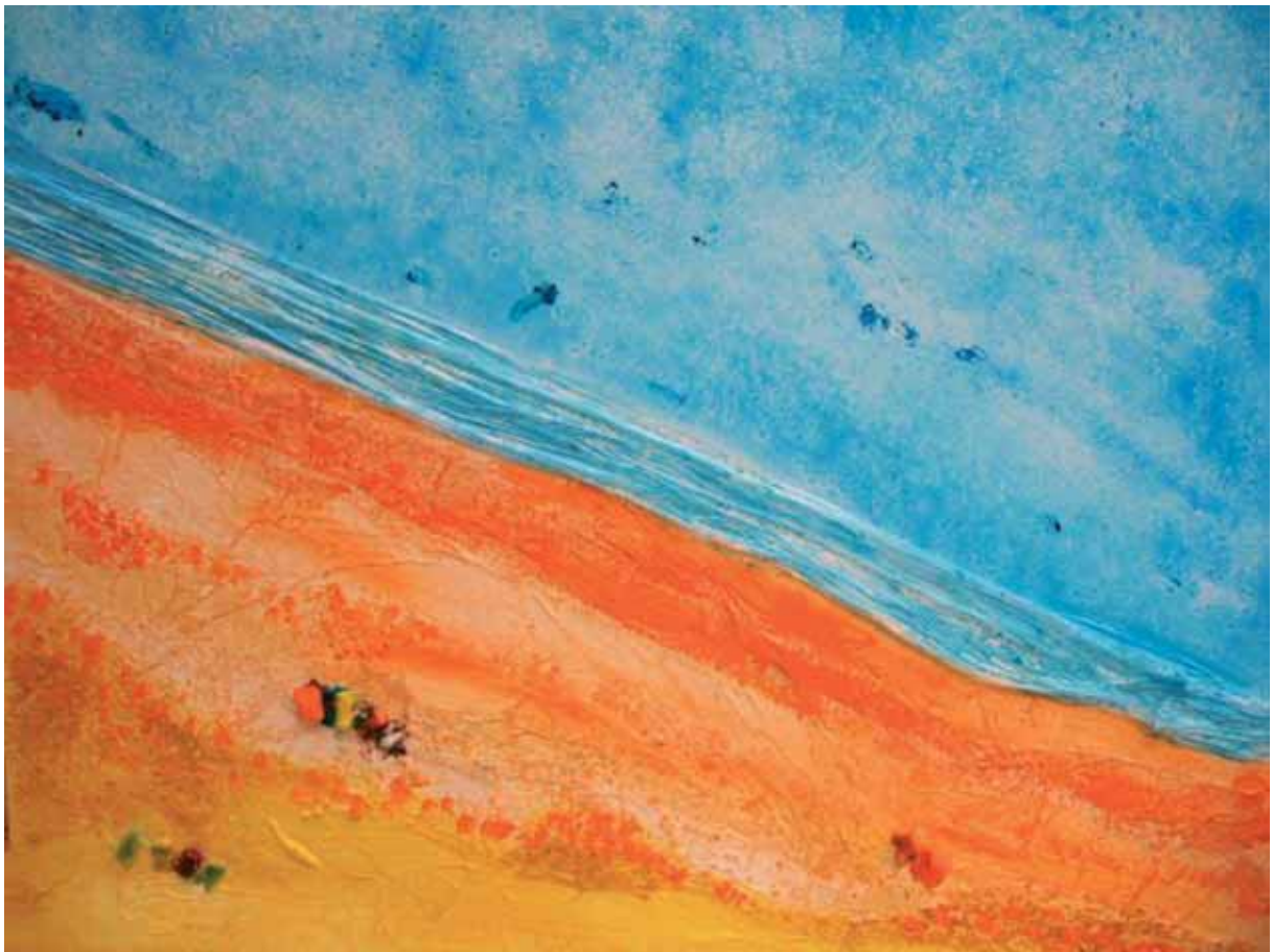
Stefania Di Lino: "A sud di cosa?" cm. 90x90, tecnica mista, 2007