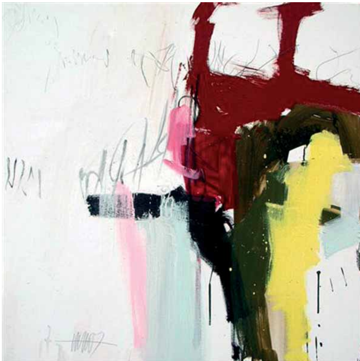
Cinzia Fiaschi: "Terre", cm.90x90, tecnica mista su tela, 2007