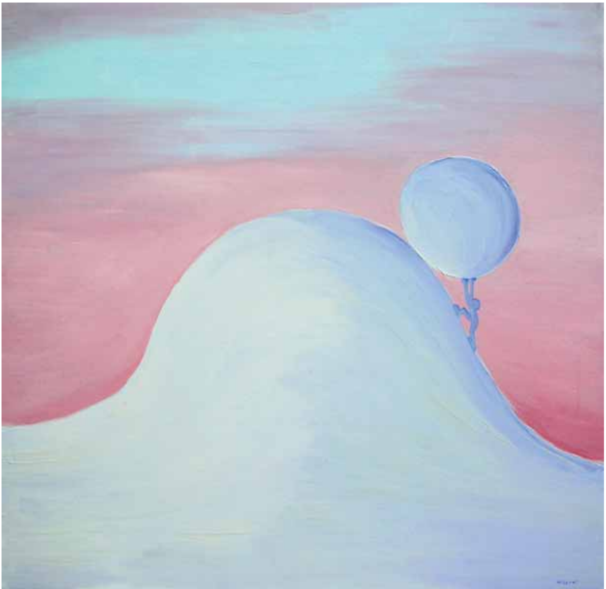
Norberto Cenci: "Very busy" cm. 90x90, olio su tela, 2007