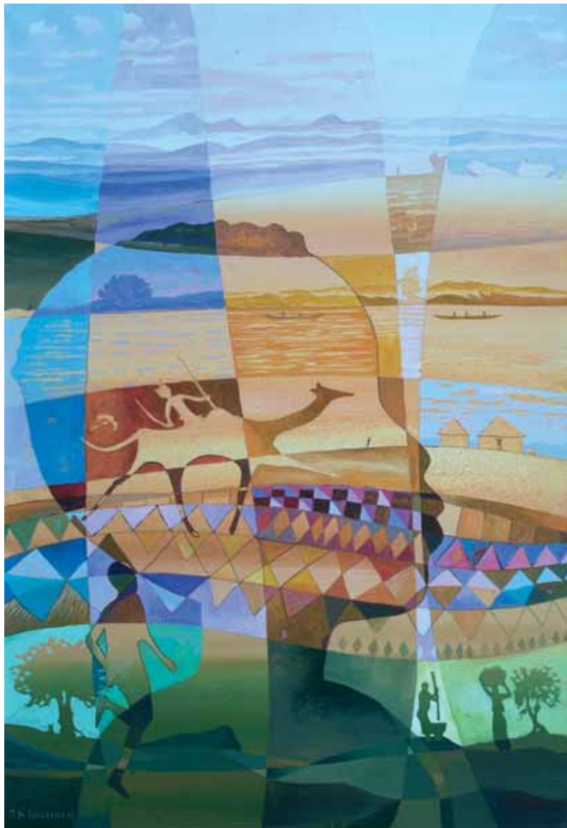
Marco Di Francesco: "Ricordi suggestivi", cm. 80x120, acrilico su tela, 2007