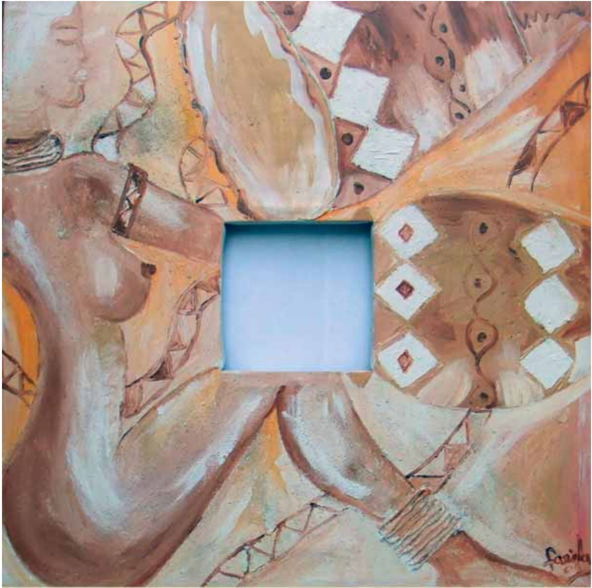
Abdul Rasaque Farida: "Perfetto", cm. 100x 100, acrilico su tela, sabbia, carta, ?????