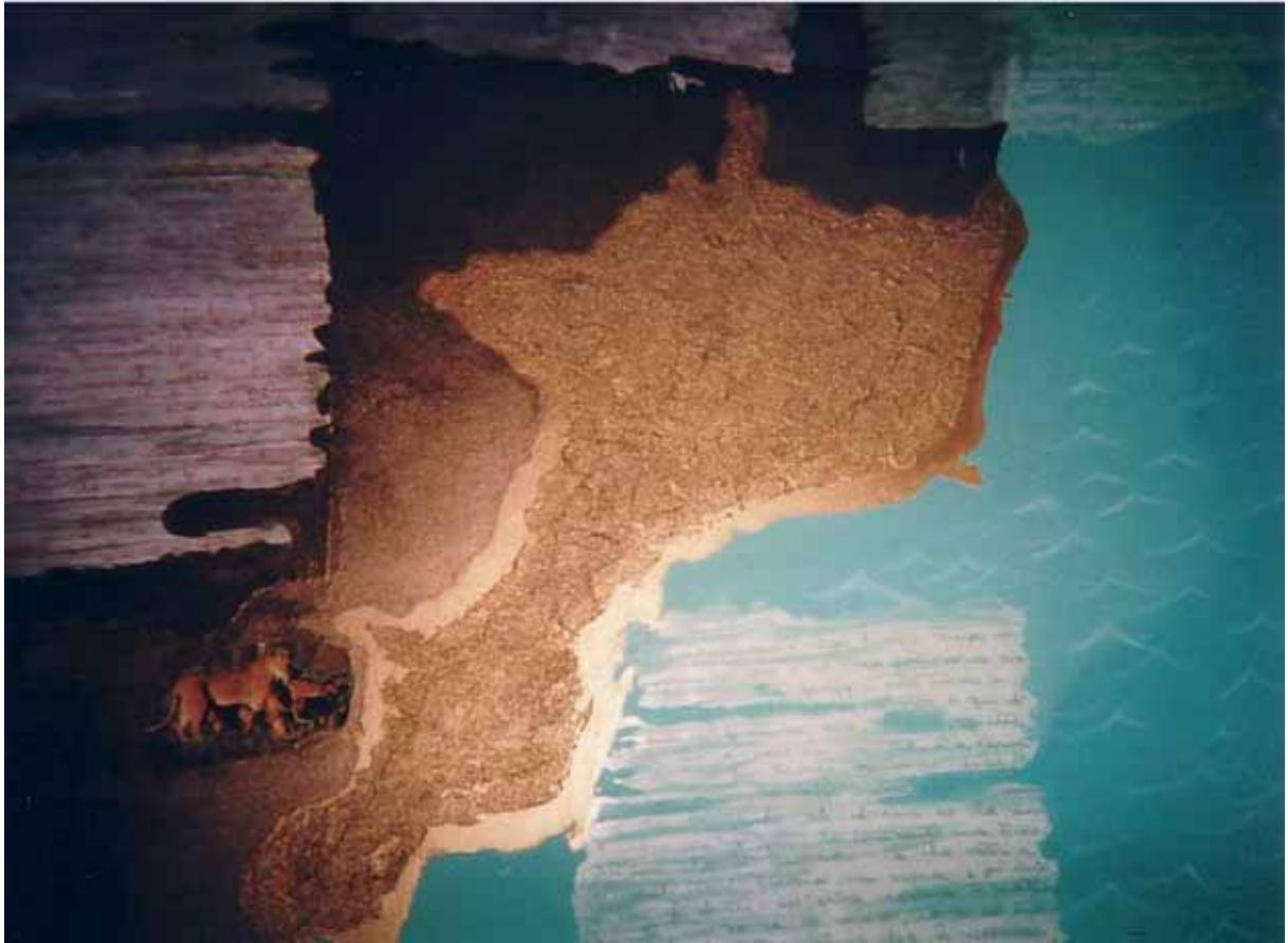
Carla Cantatore: "Lettere dal Mozambico", cm. 90x90, Tecnica mista su tela, 2007