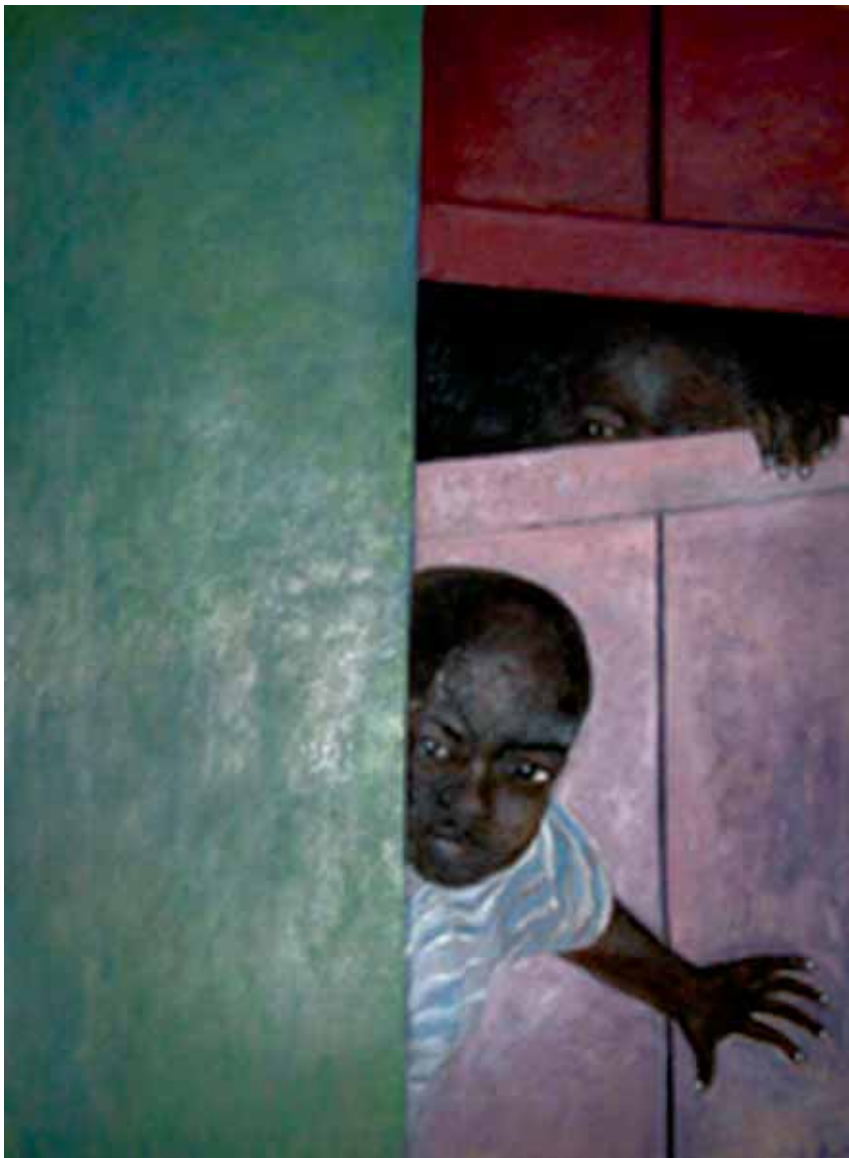
Carlo Abrosoli: "Si affacciano", cm. 75x55, olio su carta, ?????