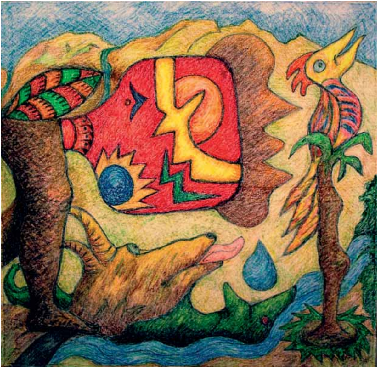
Giorgio Fiume: "Afrika Set n.3" cm.90x90, pastello a olio su tela -2007