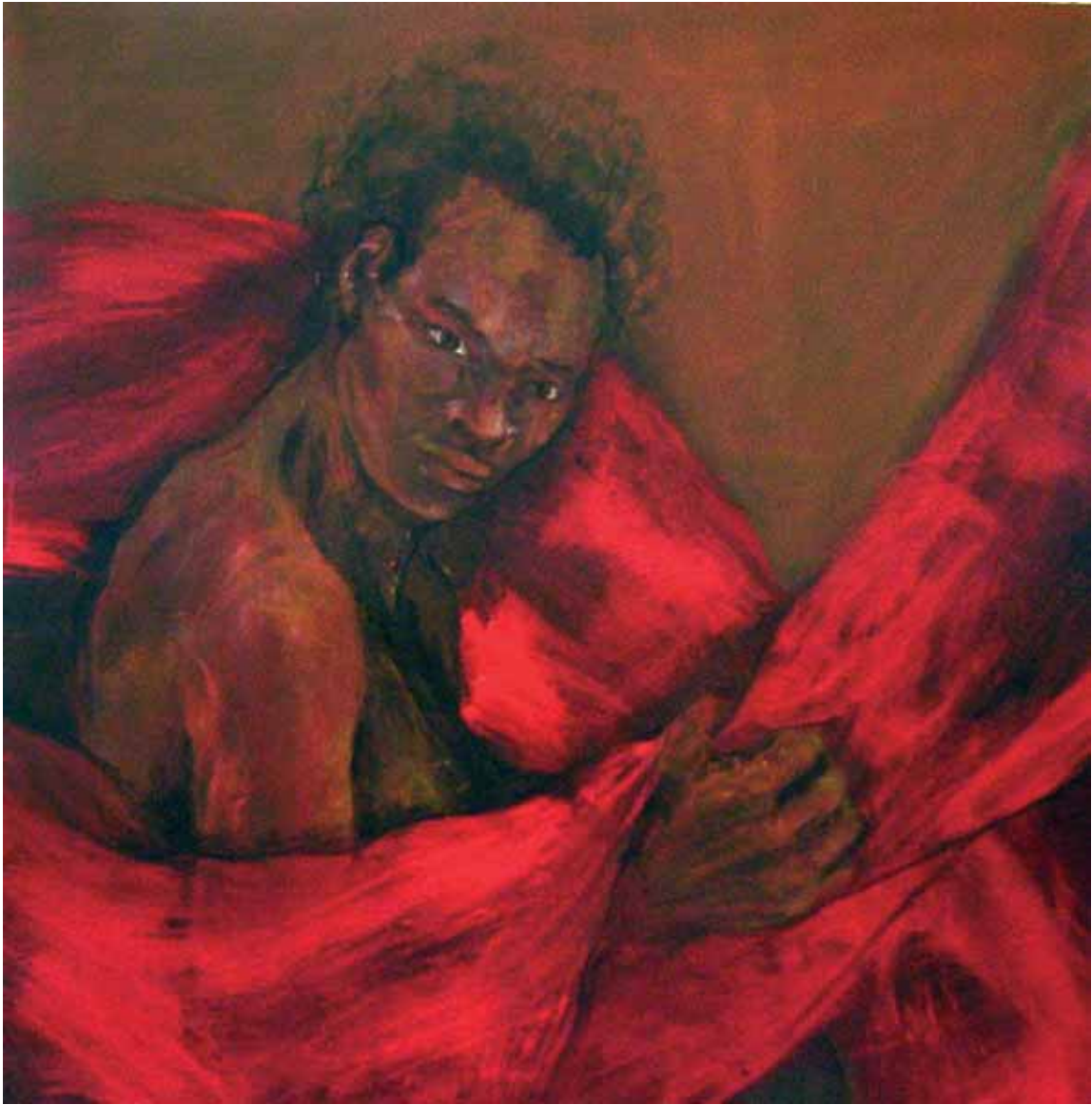
Emma Assisi: "I care" cm. 60x60, acrilico su tela, 2007