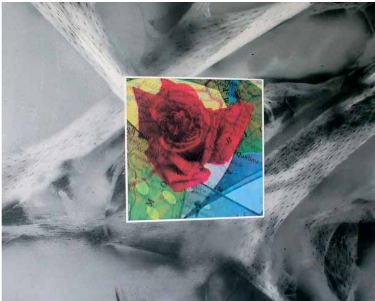
Eleonora Del Brocco: "Una rosa per te", cm. 90x90, tecnica mista, 2007